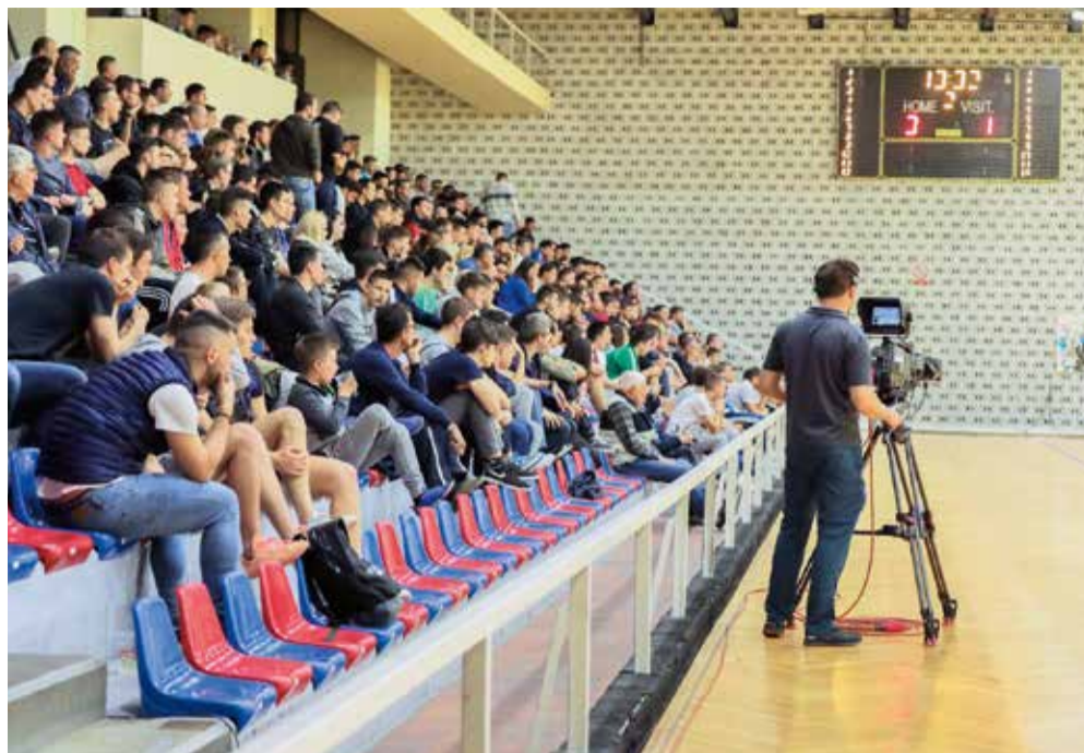
Domaće utakmice AFC Universitas često posjećuju splitski studenti i profesori, kao i brojni zaljubljenici u futsal, a klub je nekoliko puta bio u televizijskom prijenosu uživo. AFC UNIVERSITAS

Jedinstven projekt na hrvatskoj sportskoj sceni, studentski i sveučilišni klub AFC Universitas iz Splita, koji je kroz samo tri godine došao od sudjelovanja u trećoj, županijskoj ligi do nastupa u četvrtfinalu Prve hrvatske malonogometne lige, nalazi se pred novom prvoligaškom sezonom. Studenti i alumniji Sveučilišta u Splitu u svojoj su prošloj, premijernoj prvoligaškoj sezoni, uspješno etablirali se među drugim klubovima u najvišem razredu nacionalnog futsala, ravnomjerno se nadmećući sa sportskim velikanima poput Futsal Dinama, FC Splita i drugih, a nova sezona prilika im je za potvrdu učinjenog.