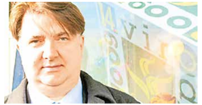
PROF. TONČI LAZIBAT

nih od strane Ministarstva znanosti i obrazovanja i Europske unije. Uz to, bio je i konzultant na više znanstvenih projekata. Razvio je nova znanstvena područja na matičnom Fakultetu: Analiza sigurnosti konstrukcija dominantno opterećenih vjetrom, Sigurnost čeličnih konstrukcija u slučaju realnog požarnog opterećenja i Rješenja numeričkih zadata primjenom metoda konačno-diskretnih elemenata za statičku i dinamičku analizu lančanica, membrana, te tankih lukova i