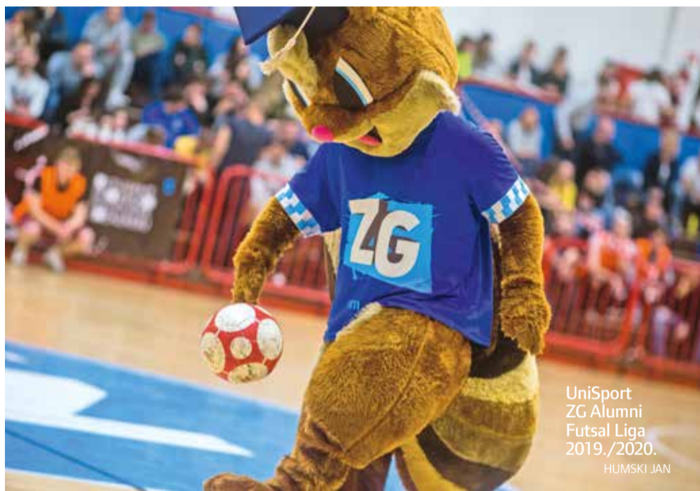
UniSport ZG Alumni Futsal Liga 2019./2020. HUMSKI JAN

Alumni Futsal Ligu u svojoj premijernoj sezoni činit će šesnaest ekipa, podijeljenih u dvije skupine, a sva su mjesta popunjena u rekordnom roku, tako da su prijave zatvorene već mjesec prije početka natjecanja