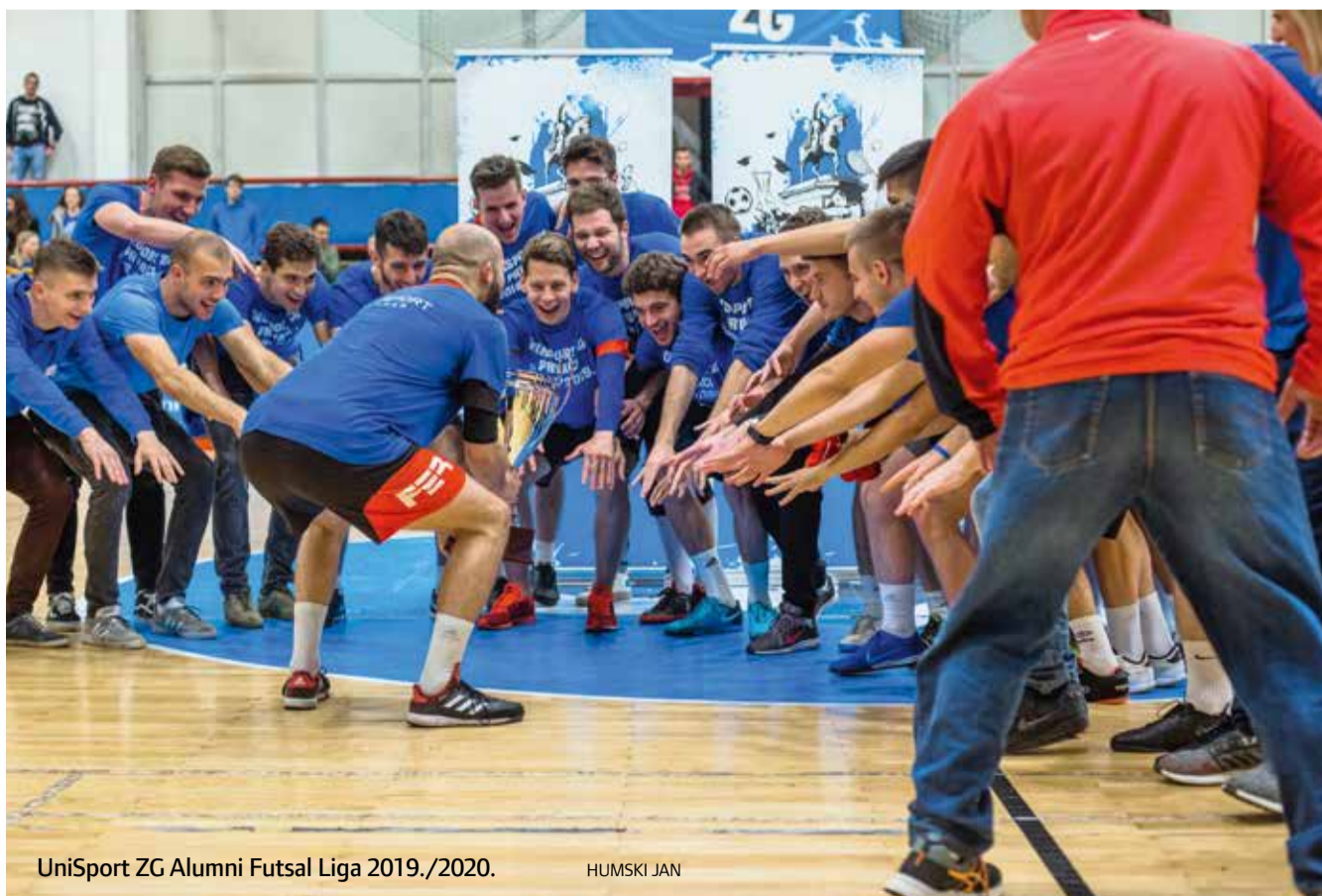
UniSport ZG Alumni Futsal Liga 2019./2020.