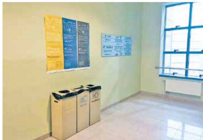
Spremnici na fakultetima

“Za sudjelovanje u projektu PAZI! prijavila sam se na četvrtoj godini fakulteta, nakon što su članice Udruge Sunce Split na predavanju iz Upravnog prava predstavile projekt studentima. Učinilo mi se to kao dobra i zanimljiva prilika. Nisam znala što me