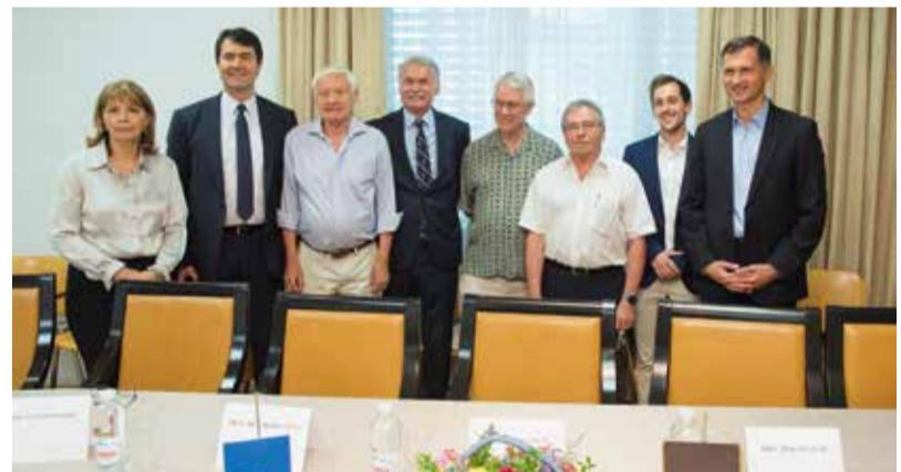
Press konferencija na Medicinskom fakultetu povodom dolaska nobelovaca profesora Joachim Frank, Richard Roberts i Georg Bednorz

organiziramo uvijek se ponavlja jedan neprocjenjivi obrazac zajedništva među svima nama koji pomažemo realizaciji projekta i istinske želje da projekt uspije jer on, ma barem malo, ostane ugrađen u svima nama. Pokazali smo ponovo, ovaj put na jednoj nevjerojatnoj razini s ukupno 4 nobelovca, da ova naša zajednica može rasti, može napredovati i da nikada ne smijemo stati u nastojanjima da ju unaprijedimo bez obri-za na prepreke na koje nailazimo. Moram i želim posebno