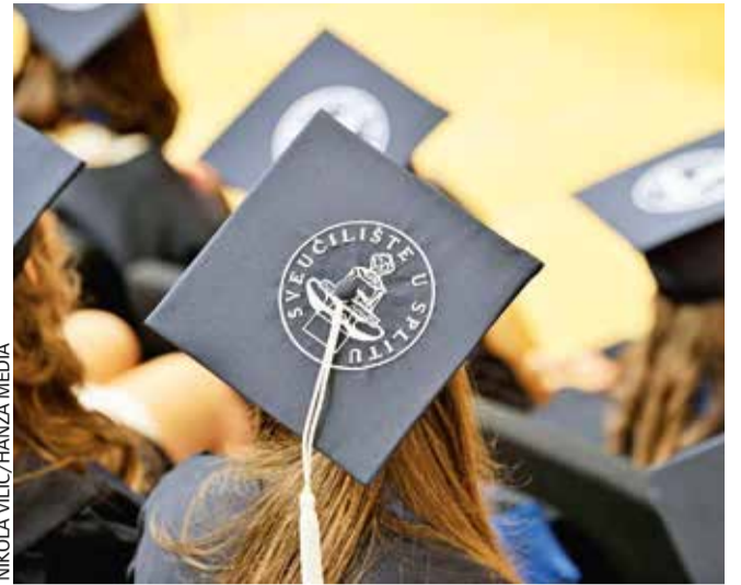
NIKOLA VILIĆ/HANZA MEDIA

Na prvom mjestu ove ljestvice našao se britanski Oxford (čak četvrtu godinu zaredom), drugi je američki California Institute of Technology, a treći Cambridge.